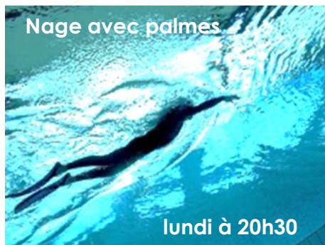
Nage avec palmes